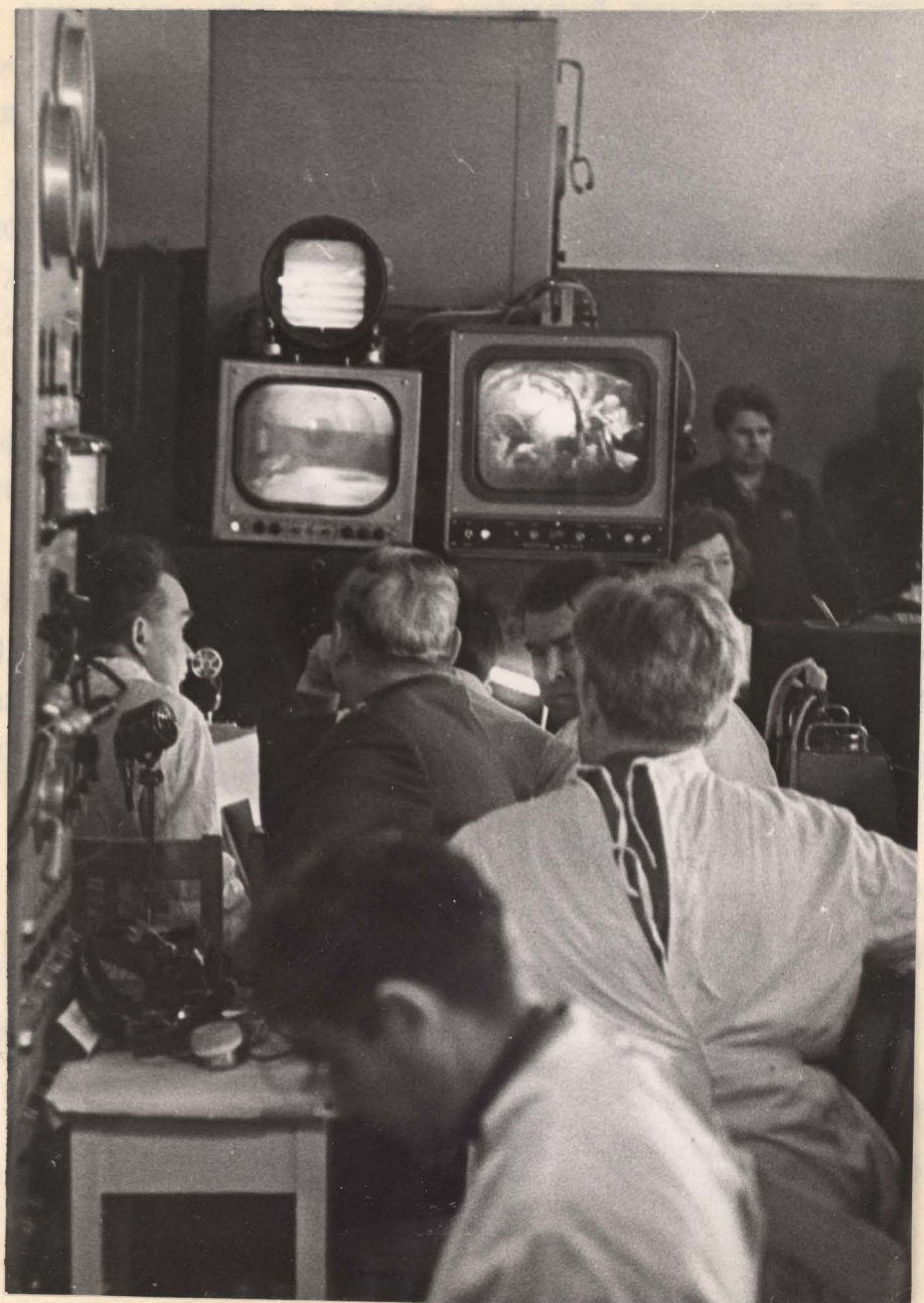
Фото 18. Общий вид телевизионных установок, электрофизиологической аппаратуры и группы врачей, осуществляющей медконтроль за космонавтами в процессе тренировки.