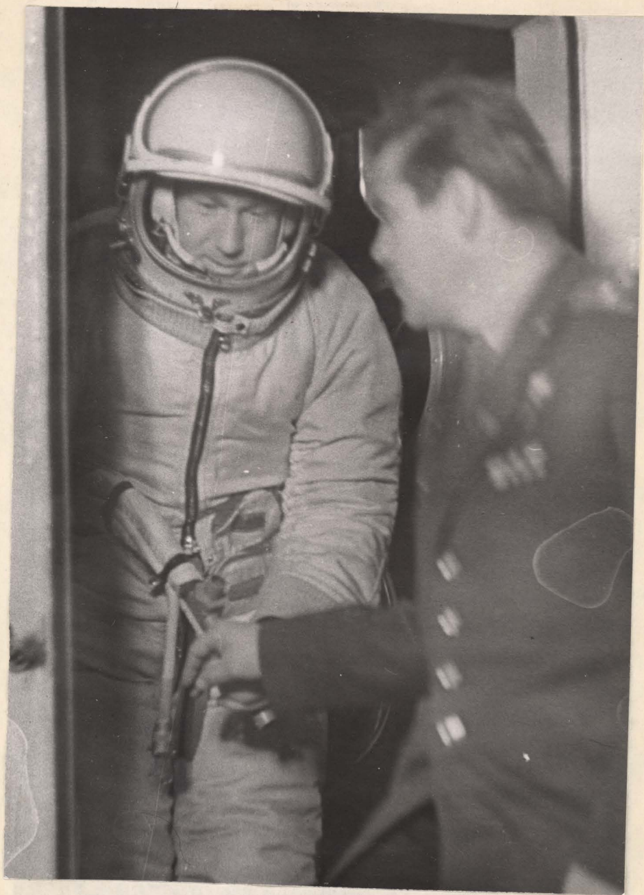
Фото № 5. Общий вид космонавта ЛЕОНОВА А.А. в скафандре СК-6.