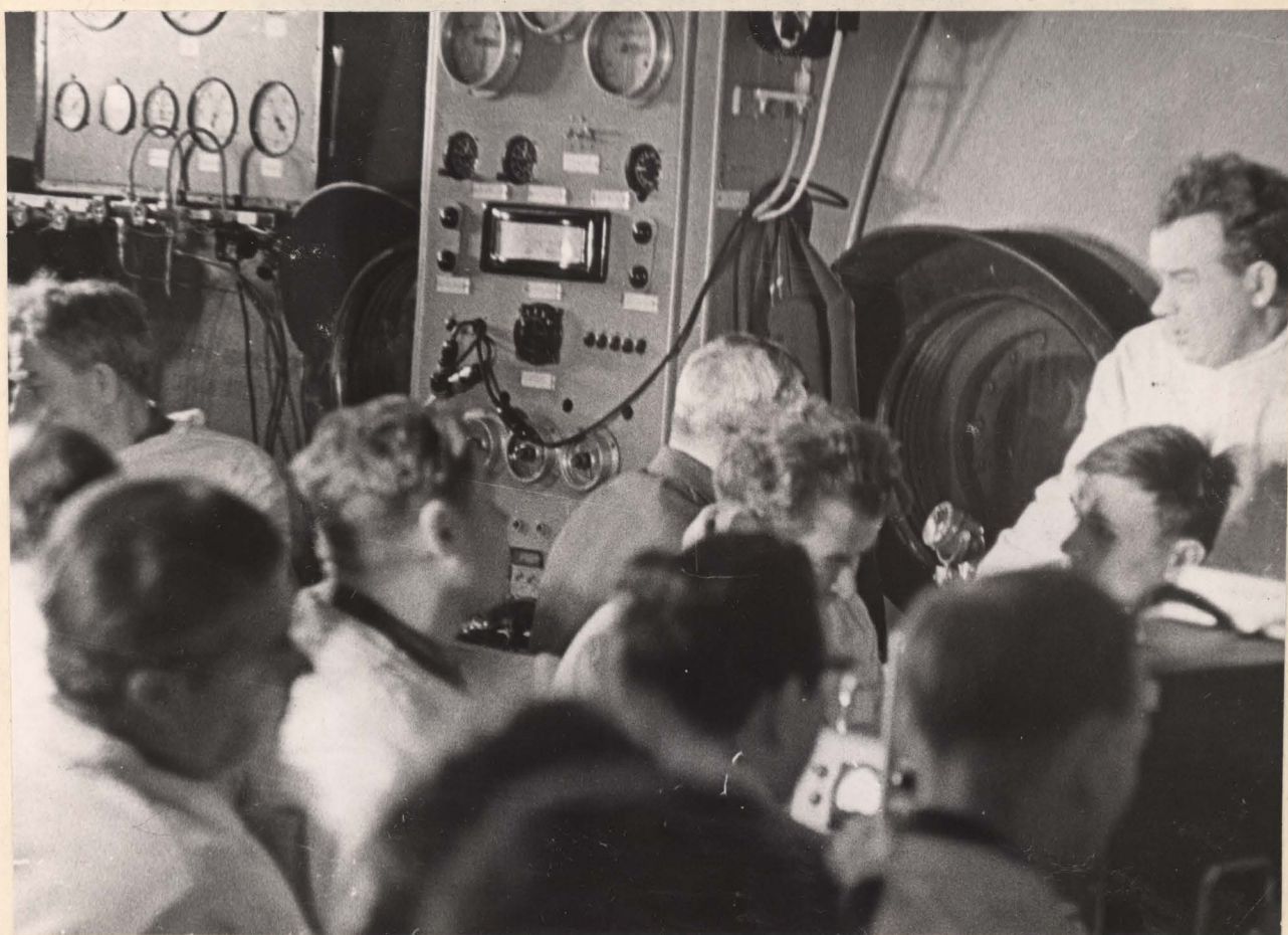
Фото 17. Главный пульт управления руководства тренировками